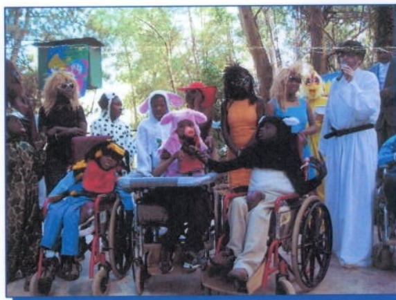
I "Piccoli Angeli" durante la festa per i 20 anni dell'orfanotrofio N.P.H. a Kenscoff in Haiti

Fondazione Francesca Rava - N.P.H. Italia Onlus