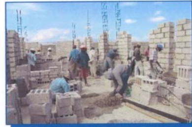
Le prime fasi della costruzione